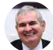
Senador Angelo Coronel