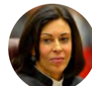
Ministra Regina Helena Costa