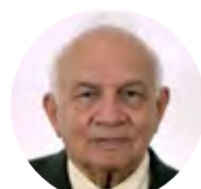
Agostinho Toffoli Tavolaro