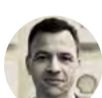
Joost M. Kutsch Lojenga - Relatórios de Transparência Fiscal