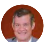
Hugo de Brito Machado Segundo - Conflitos entre o Direito Tributário, Previdenciário e do Trabalho