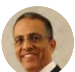
Gustavo Amaral - Desconsideração da Personalidade Jurídica na Jurisprudência do STF